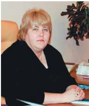
Елена БОГДАНОВА — министр культуры Республики Карелия